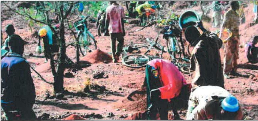
Goldsucher in Afrika